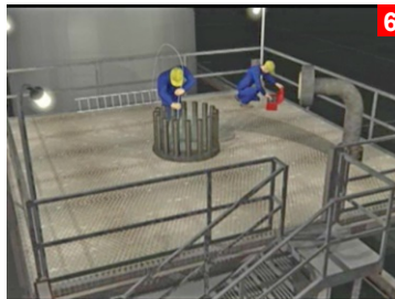
Billeder fra US Chemical Safety Board Video - http://www.csb.gov/videos/hazards-of-nitrogen-asphyxiation/

Arbejdere gjorde klar til at installere et rørstykke på toppen af en beholder i et olieraffineri (1,2). En arbejdstilladelse (3) var lavet for jobbet med en undtagelse at ingen adgang til et indelukke (Eng: “confined space entry”) var nødvendig. Jobbet bestod kun i at installere røret. Arbejdstilladelsen viste, at “Nitrogen Purge or Inerted (Atmosfære)” var N/A (Eng: Not Applicable) selvom beholderen var under kvælstoftryk (N2) (4).