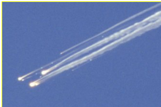
Febbraio 2003, lo Space Shuttle Columbia si rompe durante il rientro