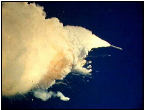
Gennaio 1986, lo Space Shuttle Challenger esplose durante il lancio