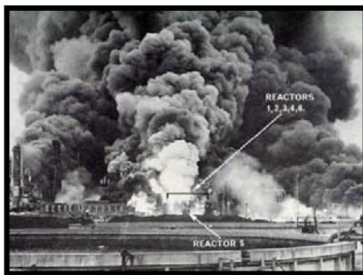
Giugno 1974, Flixborough, Inghilterra esplosione dell'impianto chimico